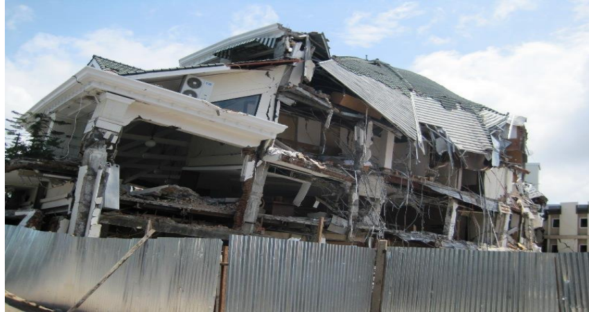
Gambar 2. Hotel Ambacang Pasca Gempa Bumi

Akibat dari hancurnya Hotel Ambacang menyebabkan banyaknya korban jiwa yaitu sebanyak 200 orang yang tertimbun oleh reruntuhan hotel pada saat terjadi gempa bumi. Banyaknya korban jiwa dikarenakan tubuh korban terhimpit oleh lantai berupa penyangga yang terbuat dari beton betulang yang mengalami kerusakan dan roboh karena tidak mampu menahan guncangan gempa bumi (Thenu, 2018). Sehingga, dapat disimpulkan penyebab banyaknya korban jiwa pada peristiwa ini diakibatkan oleh ketahanan struktur dari suatu bangunan yang kurang baik, hal ini menyadarkan kita mengenai pentingnya struktur bangunan tahan gempa untuk daerah yang rawan terjadi gempa bumi, seperti yang diketahui bahwa lokasi perencanaan tugas akhir ini berada di wilayah agam yang merupakan salah satu wilayah yang memiliki kategori resiko tinggi terhadap gempa bumi.