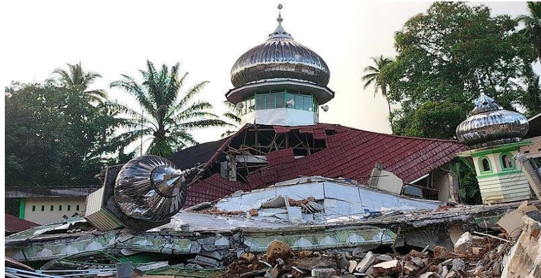
Gambar 1. Kondisi Masjid Raya Kajai Pasca Gempa Pasaman Barat

Gempa bumi terbesar yang pernah terjadi di Sumatera Barat adalah gempa pada tahun 2009 dengan magnitudo 7,9 Skala Richter di lepas pantai Sumatera Barat pada pukul 17:16:10 WIB tanggal 30 September 2009. Peristiwa ini dikatakan sebagai gempa yang menyebabkan kerusakan parah di Kota Padang dengan menunjukkan banyaknya bangunan yang runtuh. Beberapa bangunan yang mengalami kerusakan diantaranya yaitu hotel, gedung sekolah, rumah pemukiman, rumah sakit, tempat ibadah, jalan, dan perkantoran. Kerusakan bangunan ini terjadi karena bangunan yang tidak memenuhi standar bangunan tahan gempa (Prabowo, 2009).