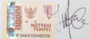
Oktaviolanda NIM. 19017024

Padang, Januari 2023 Yang membuat Pernyataan,