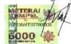
Pratomo Sumarno Putro NIM 1303297