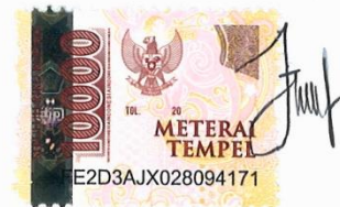
Fauzyyah NIM. 17079022