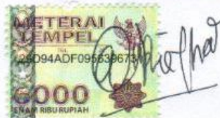
ARIA VERMISA 18587/2010

Padang, 26 Januari 2015 Saya yang menyatakan