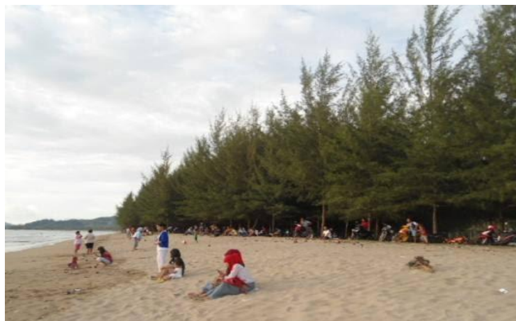
Gambar 1. Daya Tarik Wisata Pantai Muaro Bantiang

Koto XI Tarusan, Kabupaten Pesisir Selatan, Sumatera Barat. Pantai Muaro Bantiang berlokasi hanya 25 Km dari Painan dan 40 Km dari Kota Padang. Pantai Muaro Bantiang ditumbuhi dengan pohon cemara laut yang berumur belasan tahun yang menambah keindahan pantai dan keasrian alamnya. Selain itu, suasana nyaman dengan embusan angin laut terpancar dari lokasi yang bersahaja itu. Pantai Muaro Bantiang memiliki potensi alam yang indah dan lokasi yang luas sehingga dapat dikembangkan menjadi tempat wisata perkemahan karena dua kilometer lahan siap dibebaskan dari masyarakat pemilik lahan. Kalau Pantai Muaro Bantiang dikelola menjadi kawasan wisata, maka wisatawan akan banyak berdatangan. Dampak dari kunjungan wisatawan akan memberikan pemasukan ekonomi bagi masyarakat sekitar.