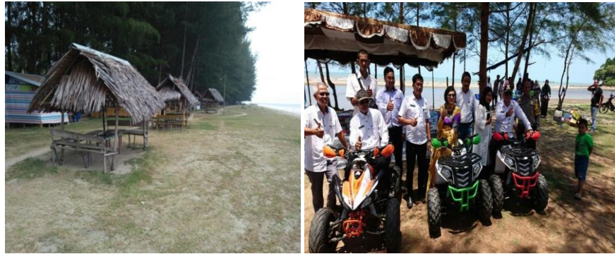
Gambar 5. Referensi pengadaan wahana bermain ATV

Permasalahan kedua yakni berdasarkan observasi peneliti, jalan menuju Pantai Muaro Bantiang sudah bagus dan beraspal akan tetapi belum adanya petunjuk jalan yang informatif untuk menuju ke daya tarik wisata. Hal tersebut terlihat pada gambar dibawah yakni belum adanya papan petunjuk jalan disimpang masuk Pantai Muaro Bantiang dan adanya ulasan pengunjung untuk pengadaan papan petunjuk jalan.