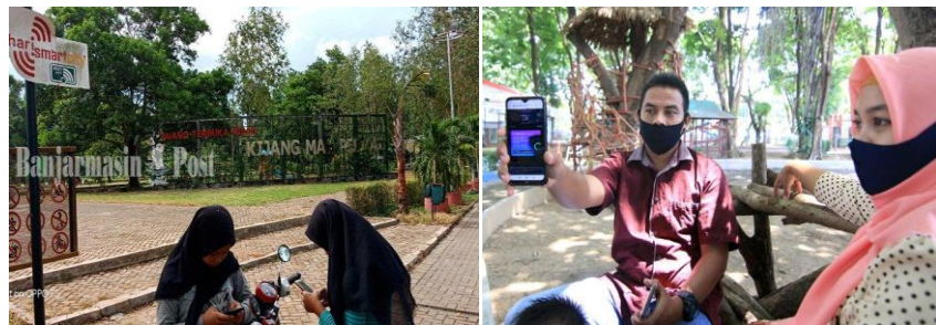
Gambar 13. Referensi pengadaan WIFI di objek wisata

Berdasarkan observasi peneliti, belum terdapat layanan tambahan seperti bank/ATM di Pantai Muaro Bantiang yang dapat memberikan kemudahan kepada wisatawan untuk berkunjung. Walaupun begitu, untuk aliran listrik sudah ada dan telekomunikasi seperti jaringan telephone seluler sudah lancar di Pantai Muaro Bantiang. Hal tersebut dapat dimanfaatkan untuk pengadaan WIFI guna untuk memberikan pelayanan tambahan kepada pengunjung. Berikut gambar beberapa objek wisata lain yang sudah menyediakan WIFI untuk pengunjung dan bisa digunakan sebagai gambaran pengadaan WIFI di Pantai Muaro Bantiang.