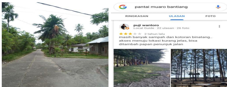
Gambar 6. Ulasan pengunjung Pantai Muaro Bantiang mengenai akses

Permasalahan kedua yakni berdasarkan observasi peneliti, jalan menuju Pantai Muaro Bantiang sudah bagus dan beraspal akan tetapi belum adanya petunjuk jalan yang informatif untuk menuju ke daya tarik wisata. Hal tersebut terlihat pada gambar dibawah yakni belum adanya papan petunjuk jalan disimpang masuk Pantai Muaro Bantiang dan adanya ulasan pengunjung untuk pengadaan papan petunjuk jalan.