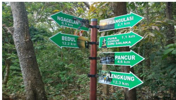
Gambar 7. Referensi pengadaan Papan Petunjuk Jalan

jalan akan membantu memudahkan pengunjung untuk berkunjung. Selain itu agar tidak ada pengunjung yang salah arah dikarenakan untuk transportasi, tidak adanya angkutan umum langsung yang dapat membawa pengunjung ke Pantai Muaro Bantiang. Sehingga untuk itu sebaiknya ada papan petunjuk jalan dan transportasi darat agar dapat memudahkan pengunjung untuk menuju daya tarik wisata Pantai Muaro Bantiang. Berikut gambar dibawah ini, bentuk gambaran papan petunjuk jalan bisa diadakan di Pantai Muaro Bantiang.