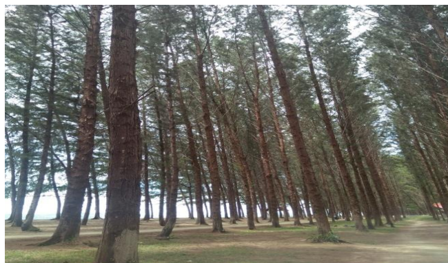
Gambar 3. Jajaran pohon pinus di Pantai Muaro Bantiang

Pengunjung mengatakan yang menjadi daya tarik Pantai Muaro Bantiang yakni pantainya yang sejuk dan udara yang segar sehingga cocok untuk bersantai. Selain itu mereka menyatakan bahwa Pantai Muaro Bantiang memiliki kondisi pantainya yang cukup bersih dengan pohon pinus yang tertata rapi sehingga enak di pandang mata.