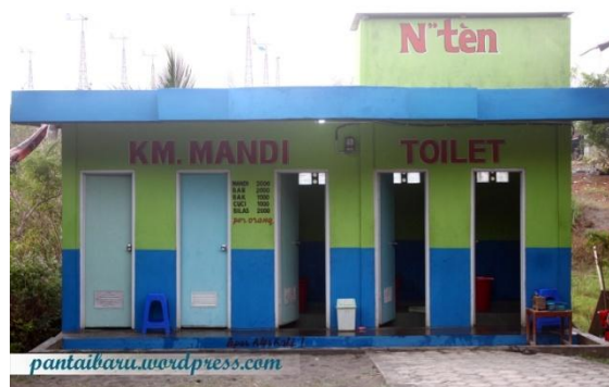
Gambar 10. Referensi penambahan toilet umum

dan melakukan perawatan toilet umum yang ada. Dikarenakan untuk toilet umum dikawasan pariwisata harus memenuhi standar dimensinya seperti toilet harus bersih dan terawat, ada penjaga toilet, tempat sampah, kelengkapan gayung dan tempat air. Berikut gambar dibawah ini, bentuk gambaran toilet umum yang dapat diadakan di Pantai Muaro Bantiang.