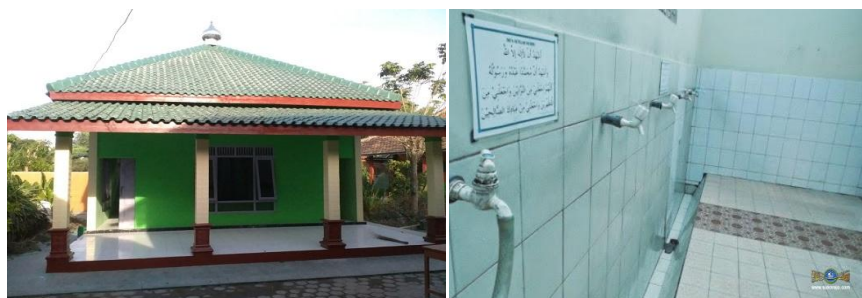
Gambar 12. Referensi penambahan Musala

Padahal berdasarkan observasi peneliti, peneliti melihat sudah adanya sumber air yang dapat direalisasi dengan baik untuk perawatan dan perbaikan musala sehingga pengunjung nyaman saat menggunakan musala. Dikarenakan untuk tempat ibadah atau musala sebaiknya memenuhi panduan pembangunan/revitalisasi tempat ibadah seperti lokasi yang mudah diakses, fasilitas membersihkan diri (tempat wudhu) yang terawat, air yang cukup dan ruangan yang terpisah untuk pengunjung pria dan wanita. Berikut gambar perbandingan musala, agar dapat digunakan sebagai referensi untuk perbaikan dan perawatan musala agar memadai di Pantai Muaro Bantiang.