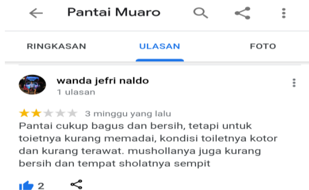
Gambar 9. Ulasan pengunjung Pantai Muaro Bantiang mengenai fasilitas

Selain itu, juga adanya ulasan pengunjung mengenai fasilitas toilet dan musala yang ada di Pantai Muaro Bantiang seperti pada gambar dibawah ini.