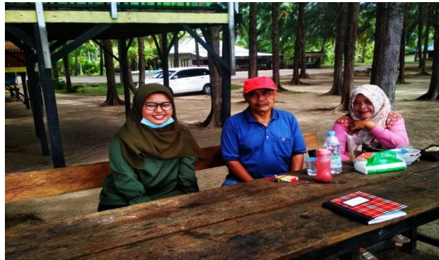
Gambar 2. Wawancara Pra Penelitian

Hasil potensi yang peneliti observasi peneliti juga dipertegas oleh pengunjung, saat peneliti mewawancarai 2 orang pengunjung pada tanggal 26 Januari 2021.