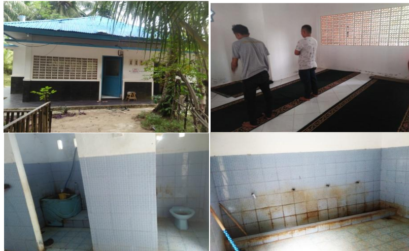
Gambar 11. Kondisi Musala yang kurang memadai

Padahal berdasarkan observasi peneliti, peneliti melihat sudah adanya sumber air yang dapat direalisasi dengan baik untuk perawatan dan perbaikan musala sehingga pengunjung nyaman saat menggunakan musala. Dikarenakan untuk tempat ibadah atau musala sebaiknya memenuhi panduan pembangunan/revitalisasi tempat ibadah seperti lokasi yang mudah diakses, fasilitas membersihkan diri (tempat wudhu) yang terawat, air yang cukup dan ruangan yang terpisah untuk pengunjung pria dan wanita. Berikut gambar perbandingan musala, agar dapat digunakan sebagai referensi untuk perbaikan dan perawatan musala agar memadai di Pantai Muaro Bantiang.