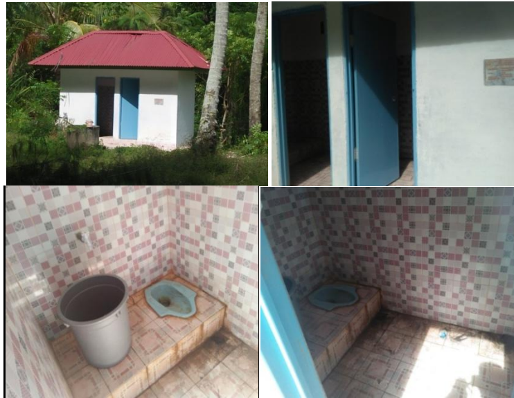
Gambar 8. Kondisi Toilet Di Pantai Muaro Bantiang

Selain itu, juga adanya ulasan pengunjung mengenai fasilitas toilet dan musala yang ada di Pantai Muaro Bantiang seperti pada gambar dibawah ini.