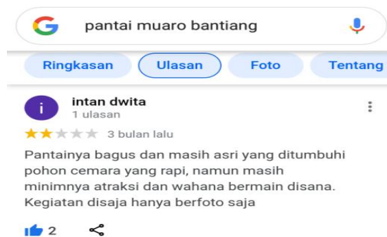
Gambar 4. Ulasan pengunjung Pantai Muaro Bantiang mengenai atraksi

dapat dilakukan oleh pengunjung, di Pantai Muaro Bantiang hanya menyediakan tempat bermain ayunan sehingga atraksi lainnya hanya melihat pemandangan dan berfoto saja. Pendapat diatas sejalan dengan komentar pengunjung di ulasan google pada gambar di bawah ini.