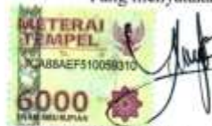
Yusra Fadli 1306962/2013