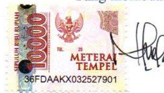
Nabila Paramita NIM 18017028

Padang, Agustus 2022 Yang membuat pernyataan,