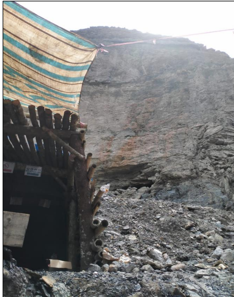
Gambar 1. Lereng CBP-02

Dari Gambar 1 di atas dapat dilihat bahwa banyaknya bongkahan longsoran yang tertahan pada pagar tersebut, hal ini menandakan seringnya terjadi longsor pada lereng tersebut. Kondisi lereng tersebut juga banyak terdapat kekar yang mengakibatkan tingginya potensi longsor yang beresiko menutupi lubang bukaan CBP-02.