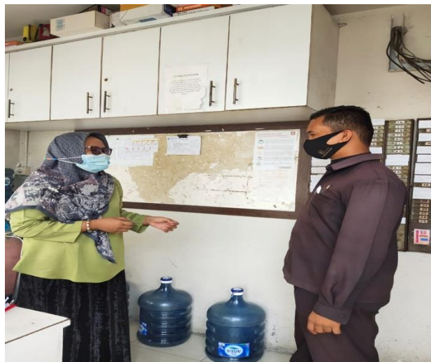
Gambar 2. Wawancara dengan karyawan security