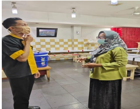
Gambar 3. Wawancara dengan karyawan kitchen

Permasalahan selanjutnya adalah adanya tingkat keterlambatan karyawan yang cukup banyak, Berikut merupakan rekapitulasi data keterlambatan karyawan Hotel Pangeran Beach Padang.