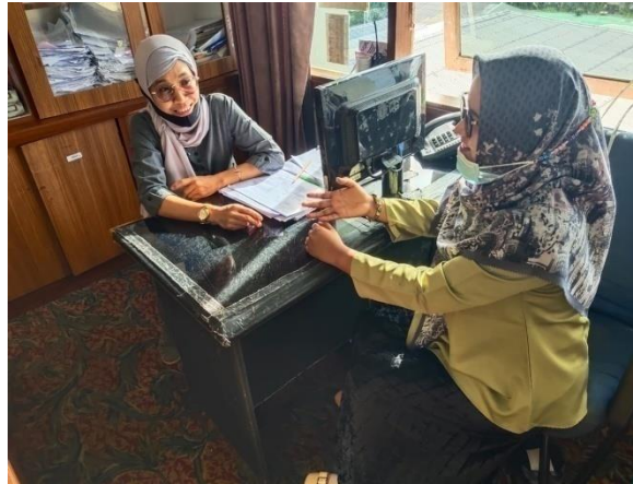
Gambar 1. Wawancara dengan karyawan Housekeeping

lembur karyawan, serta pemberhentian karyawan secara sepihak. Hal ini yang membuat lambat laun kinerja karyawan menjadi berkurang serta kedisiplinan karyawan berkurang. Dapat dilihat pada gambar dibawah ini, wawancara dengan beberapa karyawan Pangeran Beach Hotel Padang: