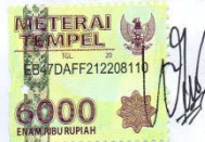
Windi Amelia NIM. 14031023