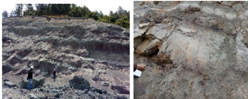
Gambar 1. Kondisi lereng dan bidang lemah pada area pit barat tambang terbuka di PT. AIC Jaya.

memiliki kondisi struktur geologi berupa bidang lemah (kekar) yang jaraknya relatif rapat, sehingga dapat mengganggu dan mengurangi stabilitas lereng tersebut.. Kondisi geometri dan bidang lemah yang terdapat pada lereng area pit barat tambang terbuka PT. AIC Jaya dapat dilihat pada Gambar 1 di bawah ini.