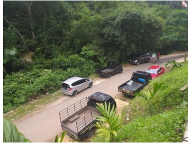
Gambar 5 Kendaraan Pengunjung Yang Parkir Di Pinggir Jalan

Berdasarkan permasalahan di atas pengelola obyek wisata hendaknya lebih memperhatikan lagi kepuasan dan kenyamanan. Untuk itu kepuasan wisatawan adalah aspek penting dalam menunjang pembangunan dan pengembangan wisata pintu angin water park . Jika fasilitas tersebut mampu memenuhi kepuasan pengunjung, maka sudah pasti objek wisata Pintu Angin Water Park berpotensi dan patut untuk dikembangkan. Maka upaya yang harus dilakukan oleh pengelola Pintu Angin Water Park yaitu terkait dengan pemenuhan indikator fasilitas utama, fasilitas pendukung dan fasilitas penunjang adapun indikator kepuasan wisatawan diantaranya, perasaan puas, berkunjung kembali, kesediaan merekomendasikan, terpenuhnya harapan.