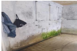
Gambar 3 Ruang Bilas

Ditinjau dari indikator kepuasan Pintu Angin Water Park memiliki ruangan ganti yang digabung dengan ruangan bilas pada saat selesai melakukan renang. Ruang ganti ini memiliki ukuran yang kecil akibatnya pengunjung harus menunggu yang cukup lama setelah berenang. pengunjung yang kurang puas dengan fasilitas umum yang tidak sesuai dengan kapasitas pengunjung.