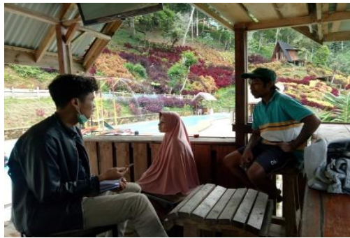
Gambar 2 Wawancara Dengan Wisatawan

Dari data tabel kunjungan wisatawan dapat disimpulkan bahwa meratanya kunjungan wisatawan dari bulan ke bulan walaupun pada masa pandemi covid 19 tetapi data ini mengalami penurunan yang signifikan karena pandemi covid 19.