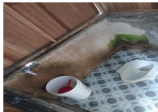
Gambar 4 Salah Satu Dari 3 Wc Yang Disediakan Pengelola