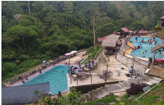
Gambar 1 Objek Wisata Pintu Angin Water Park