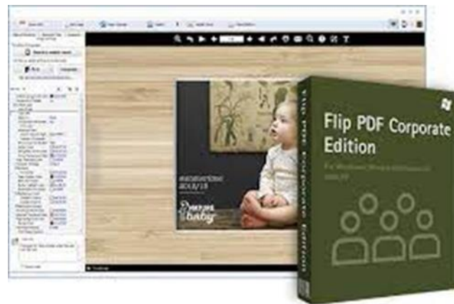
Gambar 1. Tampilan Aplikasi Flip PDF Corporate Edition