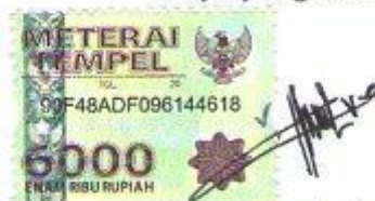
Yessilvia Azda 97796/2009