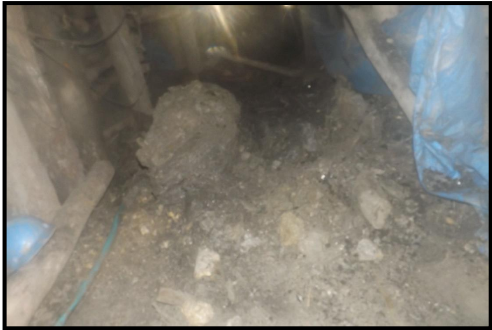
Gambar 1. Ambrukan batuan di BMK. 34

Saat melakukan tinjauan awal ke lapangan khususnya di lubang tambang BMK-34 penulis menemukan adanya ambrukan batuan, seperti dapat dilihat pada Gambar 1, Selain itu juga ditemukan adanya penyangga yang retak dan patah, berdasarkan aspek geomekanika hal ini disebabkan oleh beban batuan yang lebih besar dibandingkan kekuatan sistem penyangganya.