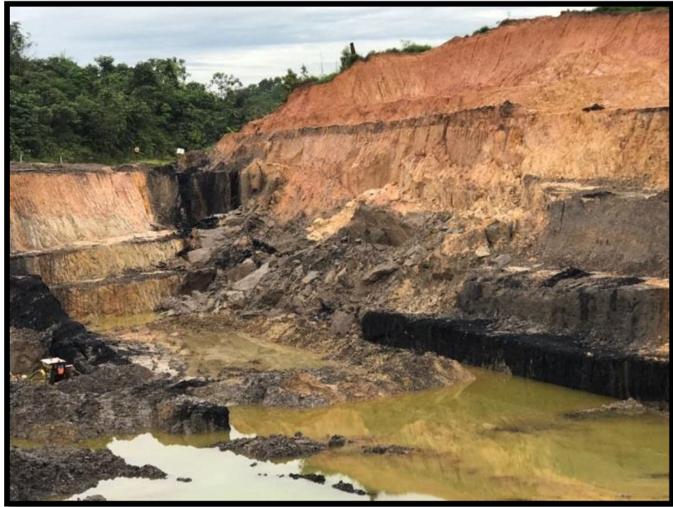
Gambar 1. Lokasi Runtuhan Pit Eagle 1 Bagian Barat

Terlihat pada gambar bahwa pada lereng Pit Eagle 1 yang didominasi dengan material tanah mengalami longsor. Longsor tersebut mengakibatkan terganggunya aktifitas produksi dan tentunya berpotensi membahayakan bagi pekerja tambang.