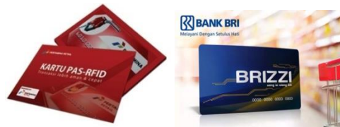
Gambar 1.1. Kartu RFID dan Kartu BRIZZI

diantaranya adalah kartu yang dikeluarkan langsung oleh PT. Pertamina yang disebut dengan kartu RFID ( Radio Frequency Identification ). Selain itu pembayaran juga dapat dilakukan dengan menggunakan kartu BRIZZI yang dikeluarkan oleh Bank Rakyat Indonesia (BRI) sebagai bank yang telah menjalin kerja sama dengan PT. Pertamina dalam penerapan sistem pembayaran BBM non tunai tersebut. Akan tetapi pembayaran juga dapat dilakukan dengan menggunakan kartu kredit, kartu debit dan kartu ATM ( Automated Teller Machine ) yang dikeluarkan oleh bank-bank konvensional seperti bank Mandiri, BNI, dan BCA. Berikut adalah gambar dari kartu RFID dan kartu BRIZZI yang dikeluarkan langsung oleh PT. Pertamina dan BRI :