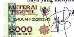
Meri Yanti 15045024/2015

Padang, Februari 2020 Saya yang menyatakan