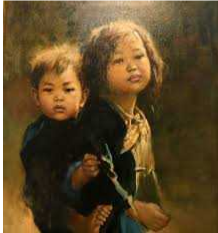
Gb.1 Adik dan kakak Basoeki Abdullah