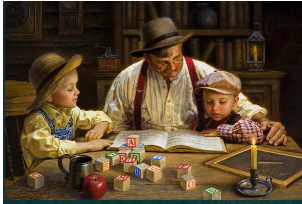
Gambar:2 Home Schooling Karya Alfredo Rodriquez Oil on Canvas

Pada pewarnaan, penulis lebih memilih corak sesuai selera sendiri karena ingin menghadirkan ciri khas penulis yang berbeda dengan pelukis lain. Adapun perbedaan karya lukis yang penulis tampilkan dalam segi pewarnaan kemudian dalam bentuk subjek yang ditampilkan. Karya-karya Alfredo Rodriquez selalu mengangkat figur manusia sebagai subjek utama dalam karyanya serta objek-objek pendukung sebagai latar belakangnya seperti alam dan juga suasana dan sekitar untuk menampilkan karakter dan gagasan dari karyanya. Sedangkan penulis menampilkan objek utama yang juga manusia yaitu tentang kegiatan batagak penghulu di Minangkabau khususnya di kanagarian Panningahan dan alam sekitar sebagai pendukung dan mempertegas karya penulis.