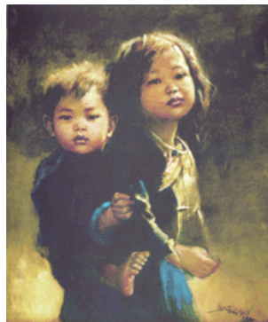
Gambar 1 Kakak dan Adik Karya Basuki Abdullah Oil on Canvas

Dalam proses penciptaan karya ini penulis akan menciptakan karya lukis dengan aliran realis. Kemudian berusaha memberikan perbedaan dari karya yang pernah ada, dan tidak meniplak langsung hasil karya seniman yang menjadi rujukan. Berikut karya yang akan menjadi acuan keorisinalan karya yang dibuat.