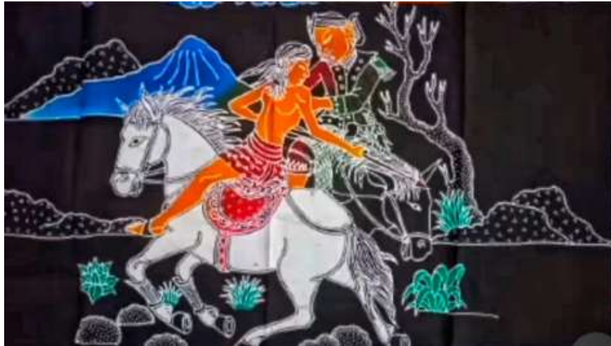
Gambar 1. Karya berjudul “Cerita Rakyat 1”