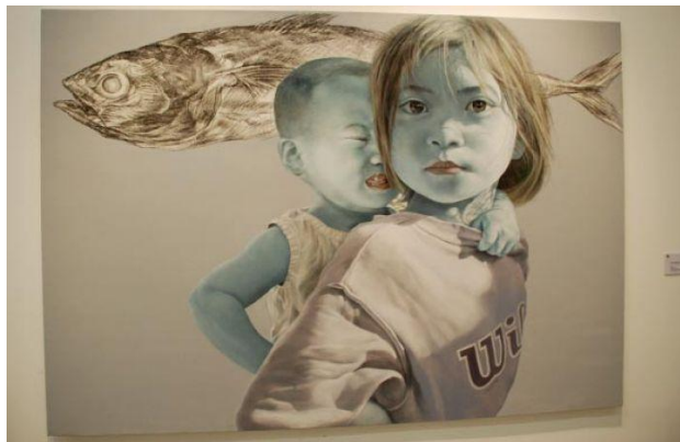
Gambar 1. Fish, Girl And Her Younger Brothe / 2009 Chusin Setiadakara

Fenomena pergaulan bebas dan perilaku seksual di kalangan remaja putri akan penulis pindahkan dalam bentuk ungkapan penyesalan seorang remaja putri akibat dari pergaulan bebas kedalam karya lukis. Karya yang divisualkan merupakan hasil karya sendiri, baik itu objek dan bentuk visual. Berbeda dari karya-karya yang pernah ada, sehingga bentuk karya penulis adalah orisinal atau asli. Dalam pembuatan karya penulis mengambil karya dari Chusin Setiadakara sebagai karya acuan.