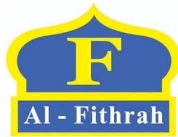
Gambar 3. Logo CV. AL-Fithrah

CV. Al-Fithrah merupakan perusahaan bisnis islami yang berdiri semenjak tahun 1998 dan beralamat di jalan Prof. D. Hamka No. 11B Padang dengan mottonya “Bergandengan tangan membangun Ekonomi Ummat”, ikut berpartisipasi dalam membangun ekonomi umat atau masyarakat yang berusaha menyediakan pelayanan terbaik dan terlengkap mungkin untuk memenuhi kebutuhan masyarakat dan konsumennya. Pada perusahaan menyediakan perlengkapan muslim dan muslimah. seperti, buku-buku islami, busana muslim/ah, herbal-herbal berkualitas.