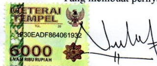
Nurjannah Ritonga NIM 2012/1200872

Padang, Januari 2016 Yang membuat pernyataan,