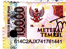
Israningtyas W NIM. 17136091