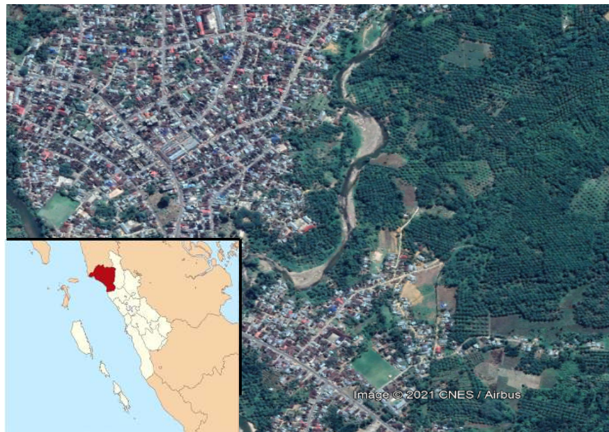
Gambar 1. Lokasi Sungai Batang Bayang Pasaman Barat

Sungai Batang Bayang merupakan salah satu sungai yang berada di Kabupaten Pasaman Barat. Sungai Batang Bayang memiliki permasalahan banjir yang terjadi hampir setiap tahun yang disebabkan oleh intensitas hujan yang tinggi dan luapan Sungai Batang Bayang.