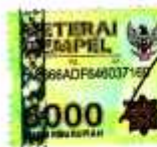
Mody Sito Filla NIM 2010/54459

Padang, 28 April 2016 Yang membuat pernyataan