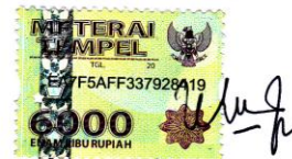
Warda NIM. 15045118 / 2015

Padang, Agustus 2019 Saya yang menyatakan