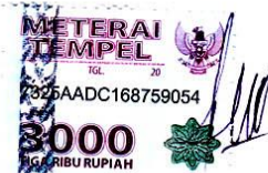
Syaiful Nim. 1208360