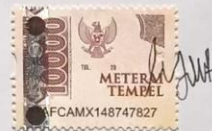
Yeni Darmiati 20058050