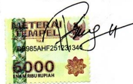
Regio Devillo 2014/14042095