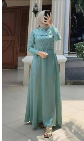
Gambar 1 : Busana pesta menggunakan borkat

Dari kondisi diatas maka pada tugas akhir peneliti menggabungkan smock jepang dan sulaman melekatkan benang emas yang bertujuan untuk menciptakan inovasi baru pada busana pesta dipasaran. Jadi pada produk ini penulis ingin menghasilkan hiasan busana pesta yang berkualitas dengan teknik tangan sendiri dengan model desain yang memakai 2 lapisan busana yaitu outer dan gaun. Maka proyek akhir ini diberi tema “ Penerapan Smock Jepang dan Sulaman Melekatkan Benang Emas pada Busana Pesta ”.