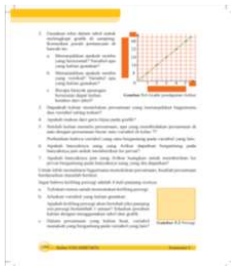
Gambar 1. Contoh Persoalan Buku Teks Peserta Didik

Perangkat pembelajaran lain yang digunakan peserta didik dalam pembelajaran adalah buku teks yang diterbitkan oleh Kementrian Pendidikan dan Kebudayaan Republik Indonesia Revisi 2017 . Menurut pendidik, sebagian besar masalah yang disajikan dalam buku teks sulit untuk dipahami peserta didik. Pendidik juga menyatakan secara umum bahan ajar yang digunakan dalam proses pembelajaran masih konvensional sehingga menyebabkan hasil pembelajaran belum optimal. Berikut ini adalah contoh persoalan dari perangkat pembelajaran yang dimaksud.