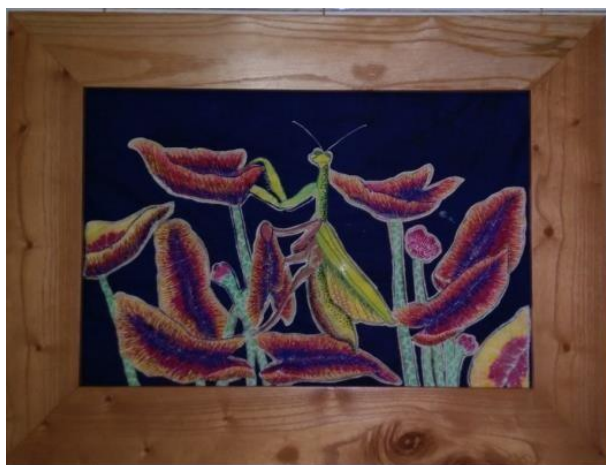
Gambar 1.1: Ketenangan

Sebagai karya pembanding dalam karya ini, penulis termotivasi pada karya batik sulam seperti di bawah ini :