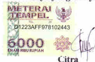
Citra NIM. 1305981/2013

Padang, November 2019 Saya yang menyatakan