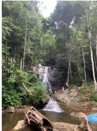
Gambar 1. Objek Wisata Aia Malanca

Jorong Landai Kenagarian Harau merupakan suatu daerah yang terdapat di Kabupaten Lima Puluh Kota. Wisata yang perlu dikembangkan di Jorong Landai Kenagarian Harau itu sendiri adalah Aia Malanca, Aia Malanca adalah wisata alam atau wisata air terjun yang dibuka pada tahun 2019 yang dimana langsung dilakukan pembangunan pada tahun 2019, pada tahun 2020 terjadilah pandemi covid 19 dimana pembangunan yang seharusnya rampung menjadi terbengkalai, pada tahun 2020 itu semua wisata di wilayah kenagarian harau ditutup.