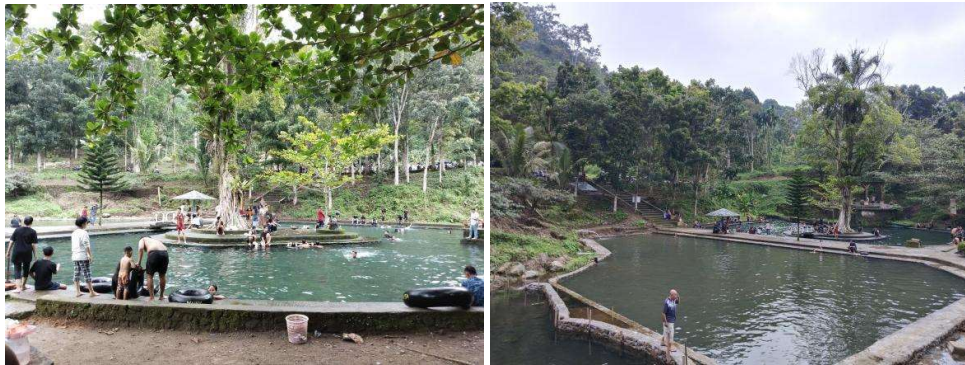
Gambar 1.2 Objek wisata Pemandian Alam Rumah Putih 2023