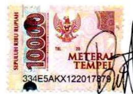
DEA YUNITA NIM. 18075007