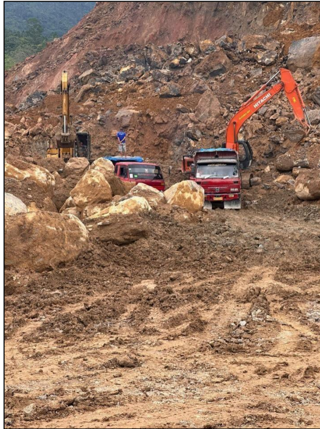
Gambar 1. Tidak adanya pemakaian Alat Pelindung Diri

Bisa dilihat pada Gambar 1 di bawah ini: