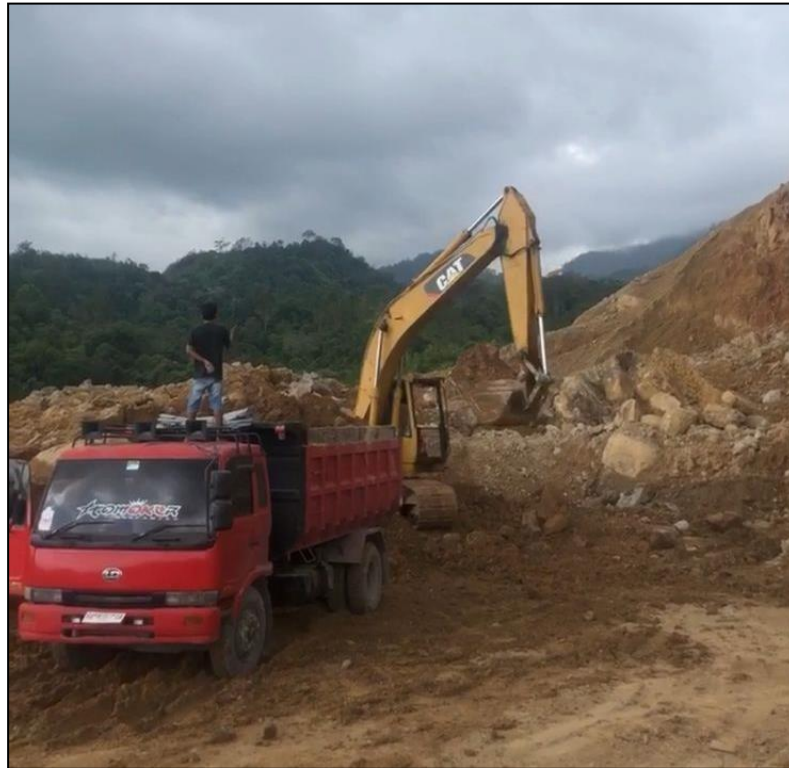
Gambar 2. Kondisi Penggalian Lempung (Clay)

Ditemukan operator dump truk tidak memakai APD serta berdiri diatas dump truck hal tersebut merupakan tindakan tidak aman yang dapat menimbulkan potensi bahaya. Posisi antara dump truck dan excavator pada saat loading terlalu dekat hal tersebut merupakan tindakan tidak aman yang dapat menimbulkan potensi bahaya seperti terbenturnya bucket excavator dengan bucket dump truck yang mengakibatkan kerusakan ( property damage )