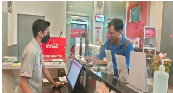
Gambar 1. Wawancara dengan salah satu karyawan di Fave Hotel Olo Padang

Berdasarkan pengalaman lapangan industri yang peneliti lakukan di Fave Hotel Olo Padang dari bulan Januari - Juli 2022 dan hasil wawancara yang peneliti lakukan dengan salah satu karyawan Fave Hotel Padang bagian reception bahwa terdapat beberapa permasalahan seperti tidak adanya reward yang diberikan kepada karyawan berprestasi seperti kenaikan jabatan atau apresiasi yang diberikan oleh atasan maupun hotel, sehingga karyawan merasa tidak bersemangat dalam bekerja. Permasalahan selanjutnya yang penulis temukan yaitu kurangnya motivasi yang diberikan oleh karyawan yang mengakibatkan karyawan banyak yang bermalas-malasan saat bekerja. Dan kurang terjalannya komunikasi antara atasan dan bawahan sehingga mengakibatkan miskomunikasi. Berikut adalah hasil dokumentasi peneliti dengan salah satu karyawan Fave Hotel Olo Padang bagian reception yang peneliti lakukan pada tanggal 1 juli 2022