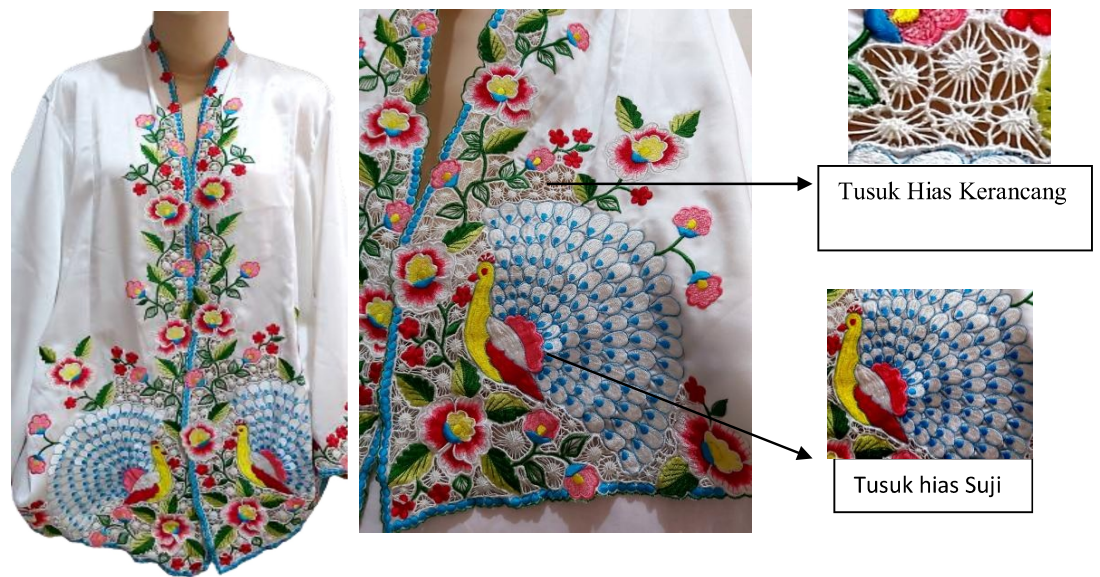
Gambar 1. Keunggulan Produk bordir kerancang pada kebaya encim

sangat baik terlihat dari hasil yang lebih rekat, kuat, dan awet. Serta desain motif yang bervariasi sehingga tidak terfokuskan pada satu motif saja dan keunggulan lainnya terdapat pada kombinasi warna, jenis warna yang digunakan sangat bervariasi seperti kombinasi warna kontras, harmonis dan monokromatis. Keunggulan kombinasi warna tersebut dapat dilihat pada gambar dibawah ini: