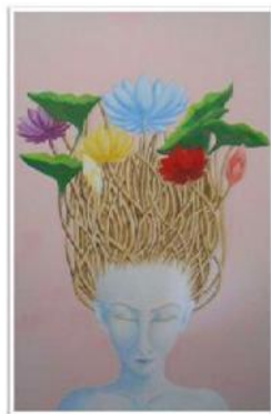
gambar 1. seniman Ratna Wulandari Wanita Menjunjung Teratai 2015, Lukisan cat minyak diatas kanvas Diakses 12 januari 2023