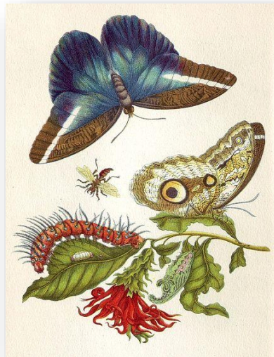
Gambar 1. “Metamorphosis insectorum Surinamensium”/37cmx51cm/Akrilik, dan Minyak di atas Kanvas (1704)

Karya yang akan menjadi acuan oleh penulis dalam menciptakan karya akhir ini yaitu seorang seniman lukis ilmiah yang bernama Maria Sibylla Merian yang berjudul “Metamorphosis insectorum Surinamensium”.