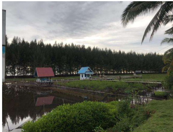
Gambar 2. Objek Wisata Utama di Desa Wisata Ampiang Parak

Berdasarkan SK No. 556/32/Kpts/BPT-PS/2021, Kenagarian Ampiang Parak, Kecamatan Sutera ditetapkan sebagai salah satu desa wisata di Kabupaten Pesisir Selatan pada tahun 2021. Desa Wisata Ampiang Parak dikelola oleh masyarakat setempat yang tergabung dalam kelompok masyarakat pengawas dan POKDARWIS. Desa wisata Ampiang Parak mempunyai daya tarik wisata yang cukup unik dengan menyediakan beberapa paket wisata, seperti paket edukasi tentang penyu, paket edukasi tentang mangrove, paket edukasi pengurangan resiko bencana untuk anak dan keluarga, dan paket tracking mangrove menggunakan kano dan jembatan kayu.