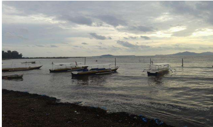
Gambar 1. Pantai Air Bangis

suatu kekuatan untuk menarik wisatawan untuk berkunjung ke objek wisata Pantai Air Bangis.