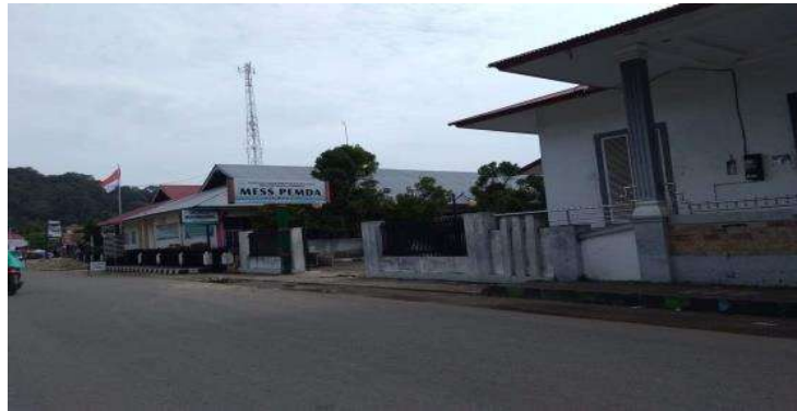
Gambar 2. Mess Pemda Air Bangis

sekitar Pantai Air Bangis dan halaman belakang Mess Pemda langsung berhadapan dengan pantai Air Bangis.