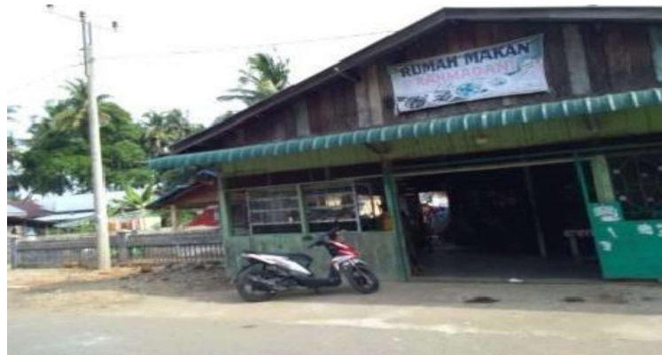
Gambar 3. Rumah Makan di Sekitar Kawasan Wisata Pantai Air Bangis

Pantai Air Bangis memiliki Rumah Makan dengan masakan khas Air Bangis. Makanan Air Bangis berupa Ketupat yang memiliki keunikan dari segi bentuk dan cara memasak yang berbeda dibandingkan dengan Ketupat pada umumnya. Cita rasa Ketupat Air Bangis dengan campuran gulai paku atau gulai nangka biasanya dihidangkan sebagai sarapan pagi. Lebih uniknya lagi ada yang menghidangkan Ketupat dengan gulai ikan hiu yang sesuai