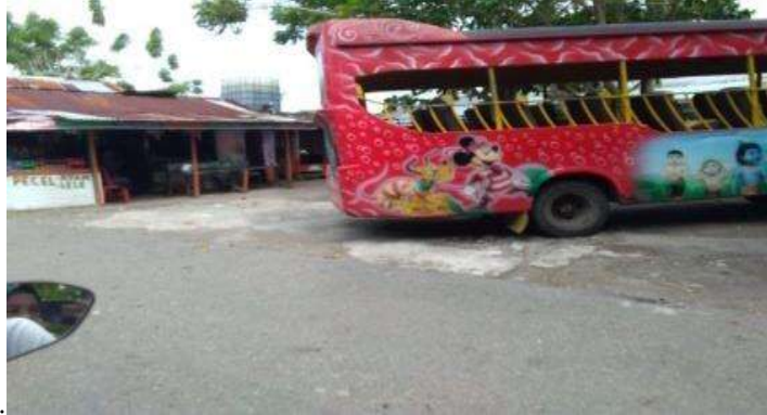
Gambar 4. Alat Transportasi Menuju Kawasan Wisata Air Bangis

namanya dibuat dengan bahan ikan hiu melalui campuran bumbu khas Air Bangis.