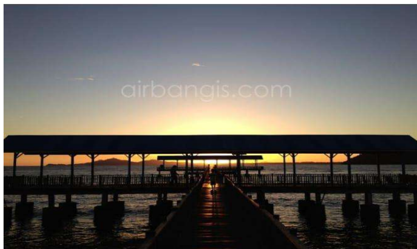
Gambar 5. Pemandangan Sunset