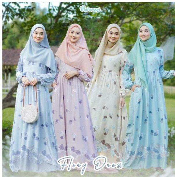
Gambar 1. 3 Busana santai