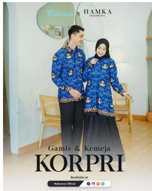
Gambar 1. 1 Busana kerja

CV. Aya Sofya merupakan salah satu perusahaan industri konveksi yang berada di kota Padang, Sumatera Barat. CV. Aya Sofya terletak di Jl. Dr. M. Hatta Koto Tinggi, kelurahan Pasar Ambacang, Kecamatan Kuranji, Kota Padang, Sumatera Barat. Perusahaan industri ini sudah berdiri kurang lebih selama 3 tahun. Saat ini CV. Aya Sofya memiliki dua merek ( brand ) yaitu Maharrani dan Hamka. Brand Maharrani dikhususkan untuk busana wanita, sedangkan brand Hamka dikhususkan untuk busana laki-laki. Adapun koleksi busana dari CV. Aya Sofya sebagai berikut: