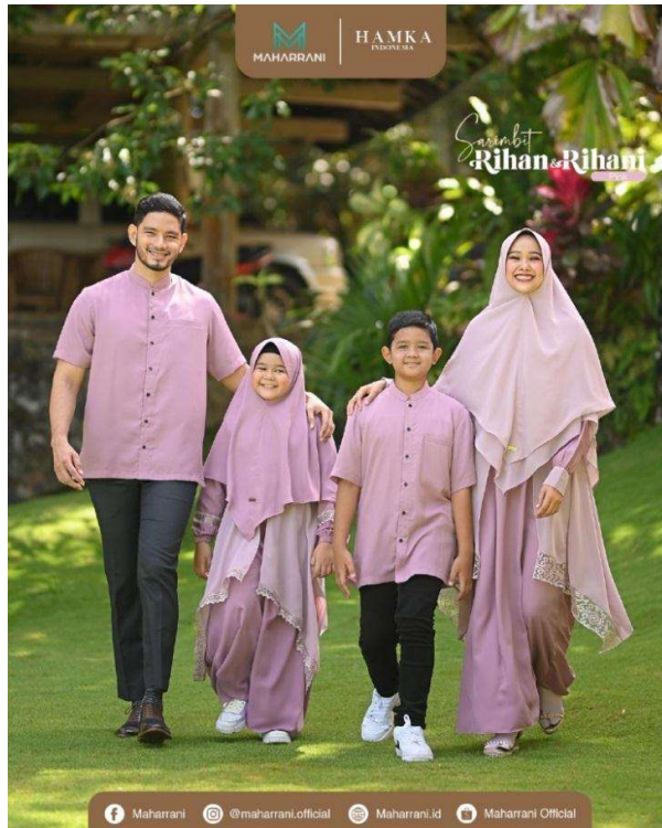
Gambar 1. 2 Busana pesta