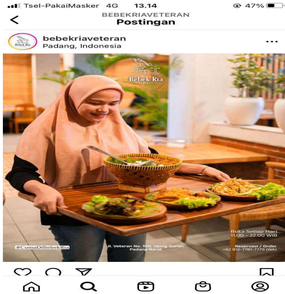
Gambar 2. Promosi periklanan dalam bentuk sosial media