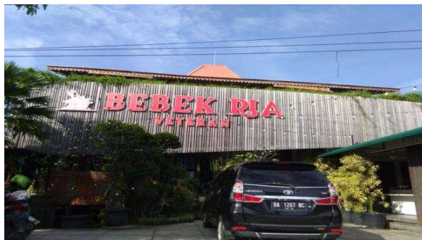
Gambar 1. Restoran Bebek Ria Padang bangunan tampak depan

Bisnis bebek merupakan usaha yang spesifik, tidak banyak persaingan namun tetap saja memerlukan strategi bisnis yang tepat agar berkembang. Daerah Sumatera Barat bukanlah penghasil bebek terbesar, penghasil bebek terbesar yaitu di daerah Jawa Barat. Tetapi dengan membuka usaha kuliner seperti usaha restoran dengan spesifik bebek sangat menjanjikan untuk.