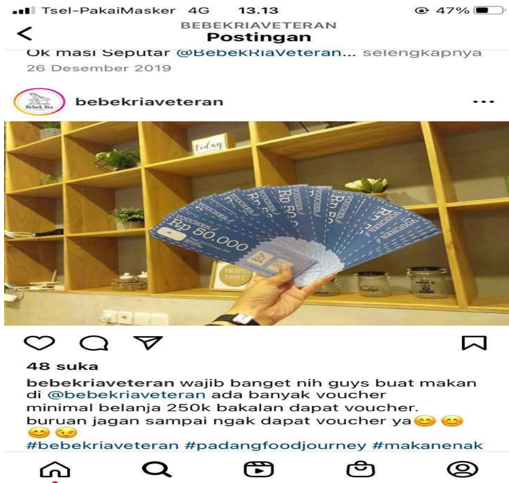
Gambar 3. Kupon yang di tawarkan restoran bebek ria padang