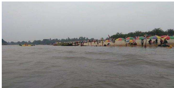
Gambar 1. Pulau Cinta Teluk Jering

Teluk Jering ini sering disebut dengan pulau cinta oleh masyarakat sekitar. Pulau yang berpasir putih ini dinamai pulau cinta karena melambangkan cinta. Pulau cinta ini merupakan sebuah pulau yang terletak di Desa Teluk Jering Kabupaten Kampar. Pulau ini menyuguhkan suasana rerumputan yang hijau, aliran anak sungai yang tenang, serta hamparan pasir putih yang luas.