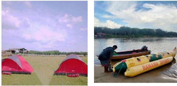
Gambar 2. Camping ground dan Permainan air

Wisata teluk jering ini merupakan wisata alam yang menyediakan lahan parkir yang sangat luas diantara lintasan dan sungai, terbentang kawasan hutan seluas 5 hektar, pengunjung dapat menikmati berbagai jenis makanan dan minuman yang dijual sekitar objek wisata tersebut dengan harga yang cukup terjangkau.