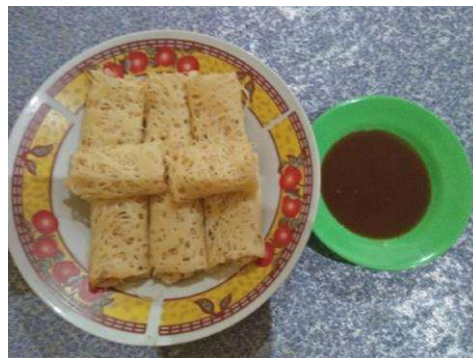
Gambar 3. Makanan khas (Kue Jalo)

Selain itu, ternyata masyarakat khususnya Pulau Cinta Teluk Jering atau kabupaten kampar memiliki makanan khas yang tidak dimiliki daerah lain yaitu (Kue Jalo). Kue Jalo adalah makanan yang terbuat dari bahan yang mudah seperti : tepung terigu, air secukupnya, garam, minyak goreng yang bisa dijadikan oleh-oleh atau menjadi kuliner khas tersendiri di teluk jering atau kabupaten kampar, makanan ini berbahan dasar manis. Uniknya makanan ini memakai kuah sarikayo dengan bahan seperti : Gula merah, santan, buah pala, kulit manis, dan tepung.