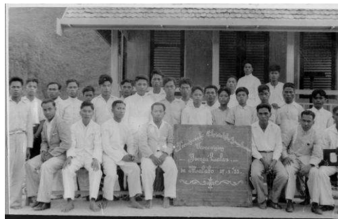
Gambar 1. Jemaat Misionaris Protestan Tanah Toraja

Menurut Wikipedia-bebas online , dijelaskan bahwa kata misionaris berasal dari mission (Inggris), yang dalam kamus Inggris-Britania diartikan sebagai an important assignment carried out for political, religious, or commercial purposes, typically involving travel . Adapun kata mission atau misionaris merupakan suatu